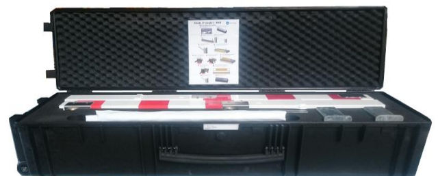
Dimensions : 43X120X35 – poids : 37 kg